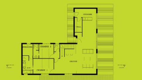
Plan Rez de jardin