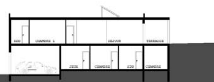
Plan de coupe

Chaudière co-génération granulé bois Production d'eau chaude solaire Ventilation simple flux Coût du chauffage : 1 200 euros / an