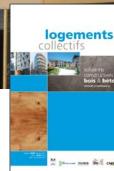
CNDB mars 2011

Ce tarif comprend le support pédagogique, la visite et le repas de stage.