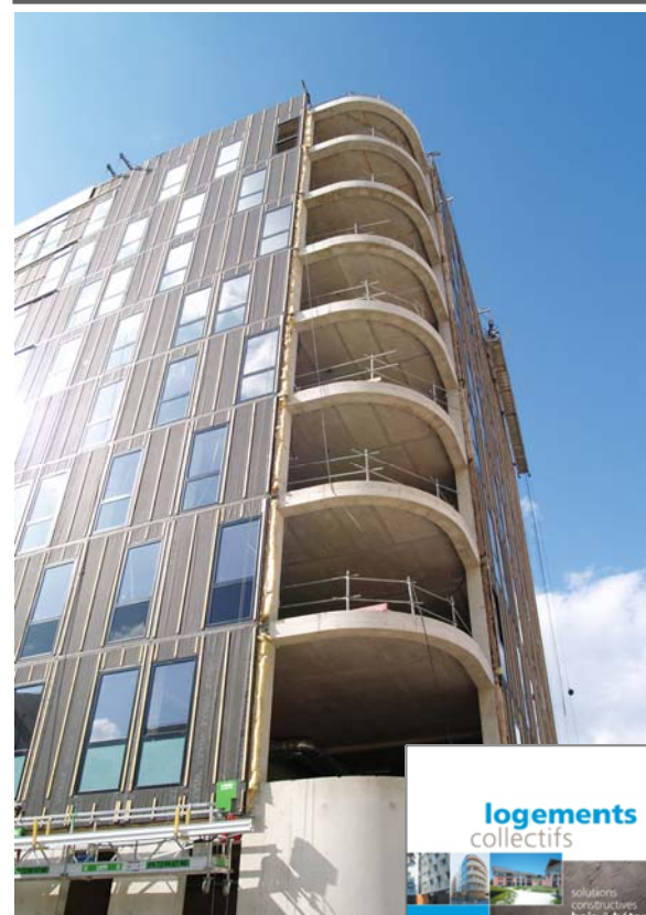
Immeuble Marbotte Plaza (21) Architecte : AS Architecture Studio (Paris) Entreprise Bois : Arbonis (69)